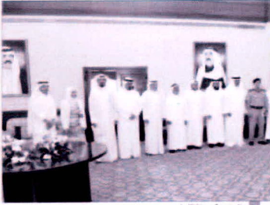
الحضور في صورة استشارية