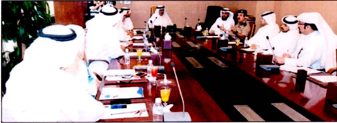
جانب من الاجتماع الذي عقد بين مسؤولين من وزارتي الداخلية والتربية