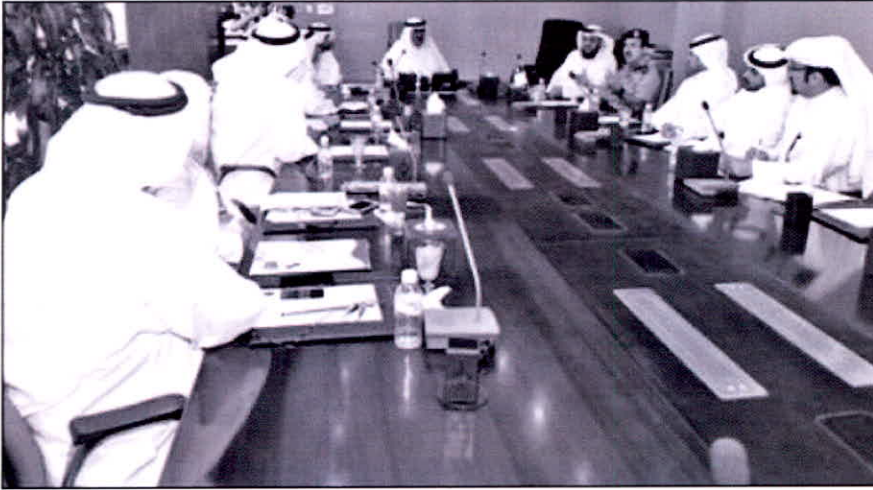
• جانب من الاجتماع التنسيقي لوزارة الداخلية مع الهيئة العامة للتعليم التطبيقي

انطلاقاً من تعليمات نائب رئيس مجلس الوزراء وزير الداخلية الفريق م. الشيخ خالد الجراح وشاكيدا لأوامره المباشرة باستمرار تنفيذ حملة وطنية للوقاية من المخدرات حماية لشباب الوطن باعتبارهم في مقدمة أولويات وزارة الداخلية من خلال استراتيجية عمل موحدة بالتعاون مع مؤسسات الدولة الرسمية وغير الرسمية تقوم على عدة محاور لمجابهة هذه الأفة التي تعد بحق طاعون هذا العصر. واستمراراً للتعاون والتنسيق المستمر بين وزارة الداخلية ومؤسسات الدولة المختلفة عقد أمس اجتماع تنسيقي بين وزارة الداخلية ممثلة في الإدارة العامة لمكافحة المخدرات والإدارة العامة للعلاقات والإعلام الأمني والهيئة العامة للتعليم التطبيقي والتدريب. وقد ركز الاجتماع على إيجاد آليات جديدة معتمدة للتعاون الفعال بين وزارة الداخلية والهيئة العامة للتعليم التطبيقي والتدريب في مكافحة المخدرات والمؤثرات العقلية والوقاية منها وذلك من خلال دور عمادة شؤون الطلبة وعمداء الكليات ومدراء المعاهد في الاكتشاف المبكر والإبلاغ عن أي حالة تعاطي مخدرات وبيث الوعي بخطورة أفة المخدرات والمؤثرات العقلية بين صفوف الطلاب والطالبات في مختلف الكليات والمعاهد من خلال المحاضرات التوعوية ونشر