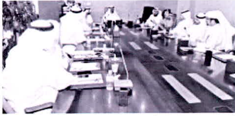
على سبل الوقاية وحمايتهم.