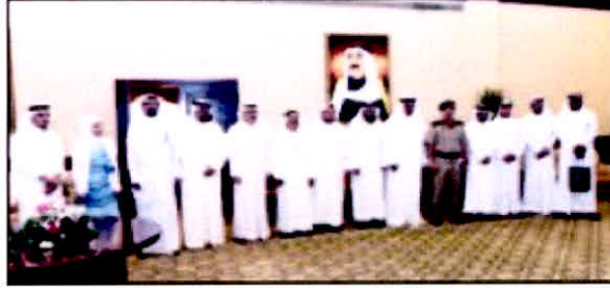
للمشاركين في الاجتماع

عقدت وزارة الداخلية ممثلة في الإدارة العامة لمكافحة المخدرات والإدارة العامة للعلاقات والإعلام الأمني والهيئة العامة للتعليم التطبيقي والتدريب، اجتماعاً ركز على إيجاد آليات جديدة معتمدة للتعاون الفعال بين الوزارة والهيئة في مكافحة المخدرات والمؤثرات العقلية والوقاية منها وذلك من خلال دور عمادة شؤون الطلبة وعمداء الكليات ومديري المعاهد في الاكتشاف المبكر والإبلاغ عن أي حالة تعاطي مخدرات وبت الوعي بخطورة أفة المخدرات والمؤثرات العقلية بين صفوف الطلبة.